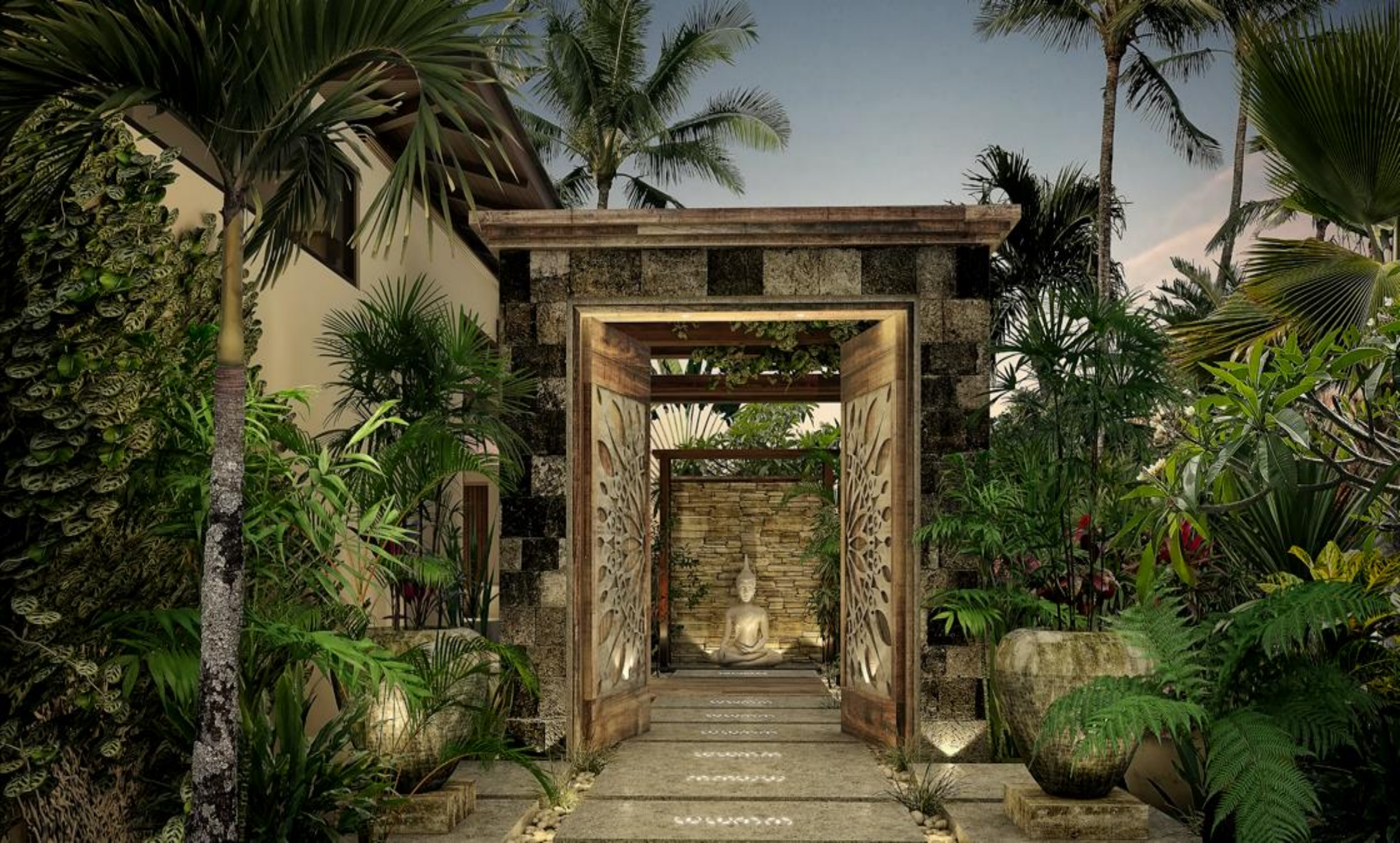
Entrée de la Villa