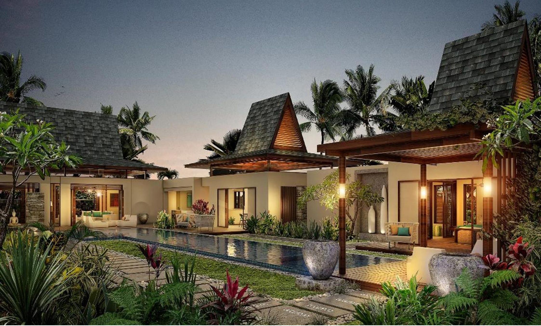
Vue du Jardin