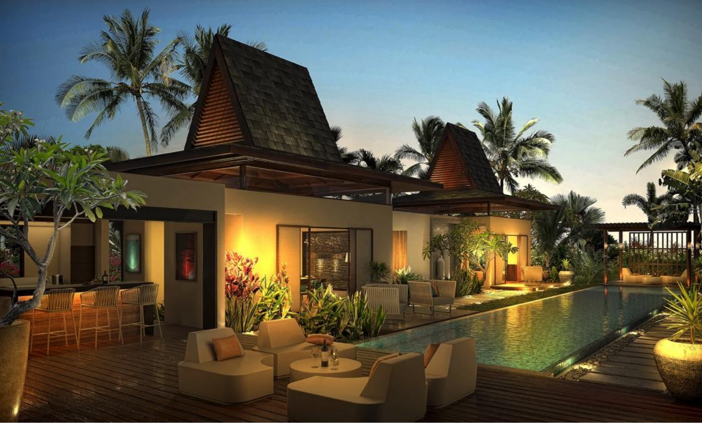
Vue du Jardin