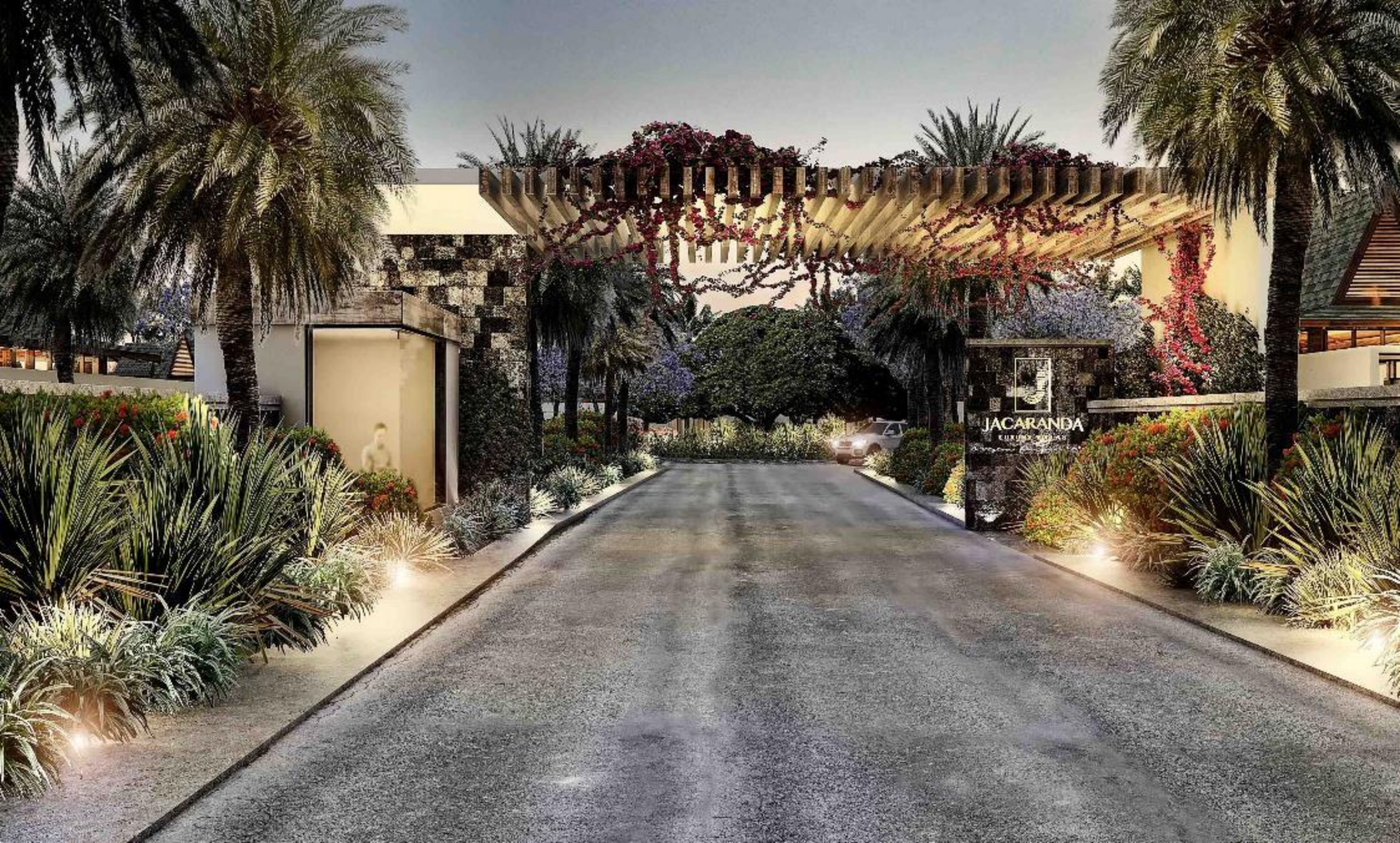
Entrée Principale de JACARANDA