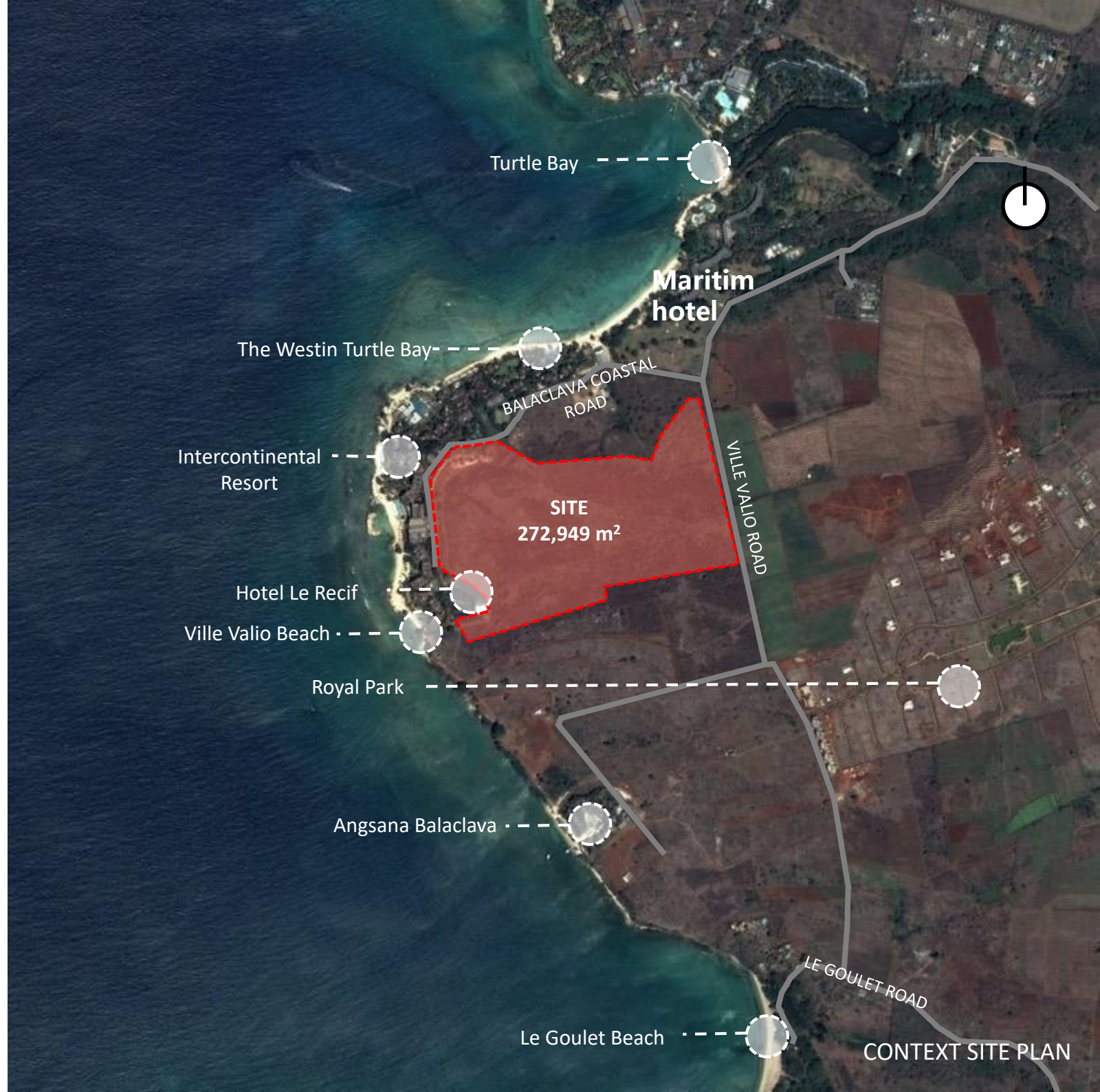
CONTEXT SITE PLAN

Architecte & Architecte paysagiste renommés ( SO Sofitel Mauritius, Four Seasons Hotel Mauritius)